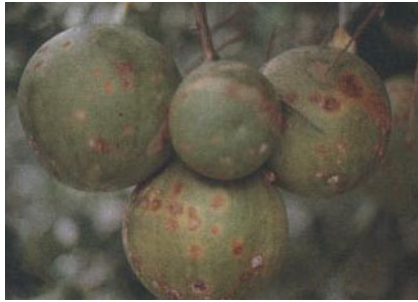
โรคแดงเกอร์