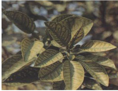
โรคใบแก้ว