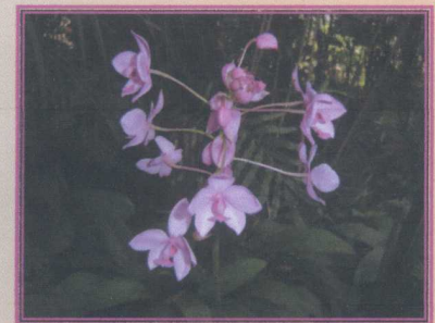
เอื้องดินใบหมาก