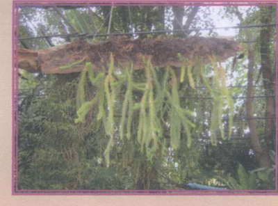
ช้องนางคลี่