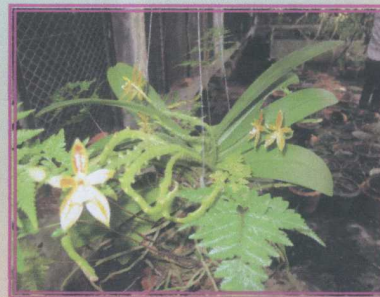
เอื้องเขากวางอ่อน