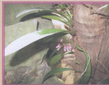
สิงโตพัดโบก