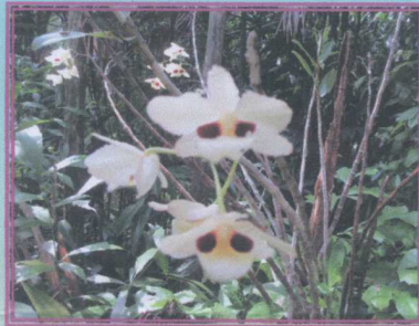
เอื้องช้างน้ำ