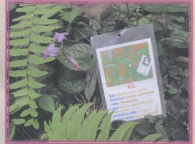
เอื้องม้าวัง