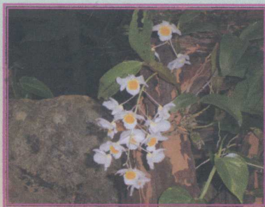
เอื้องมัจฉานุ