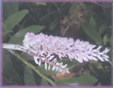
เอื้องแปลงสีพื้น