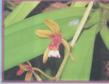
กะเรกะร่อนปากเปิด