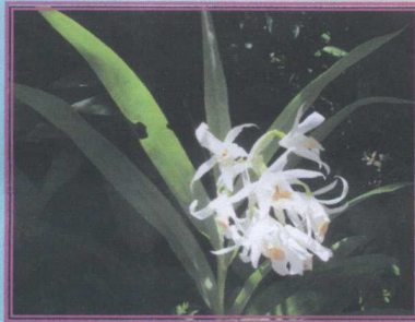
เอื้องช้างงาเคียว