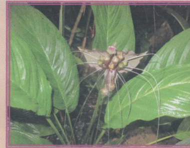
ว่านค้างคาวดำ