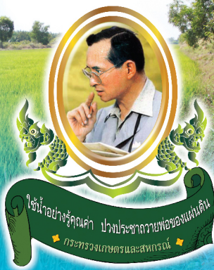
ใช้น้ำอย่างรู้คุณค่า ปวงประชาทายาทของแผ่นดิน กระทรวงเกษตรและสหกรณ์