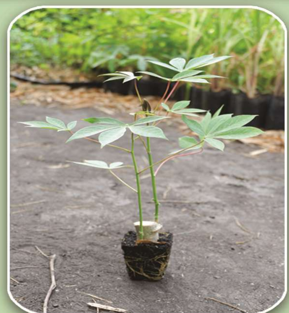
ต้นที่ได้จากการชำต้น