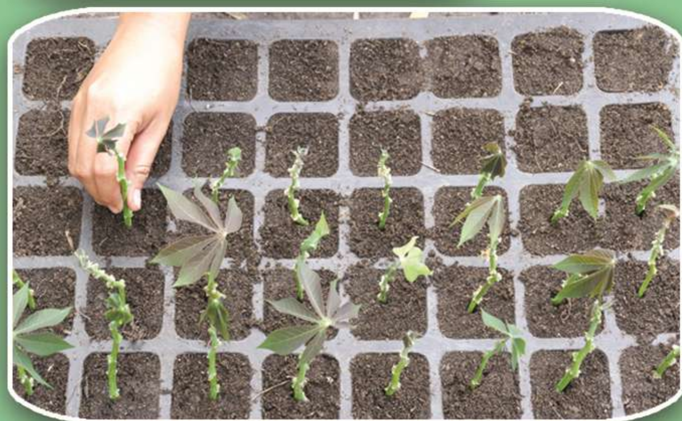
ปักชำลงวัสดุปลูก