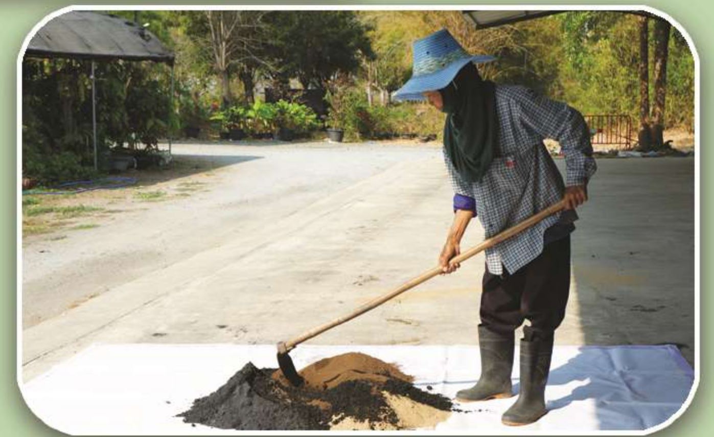
วัสดุในการปักชำ