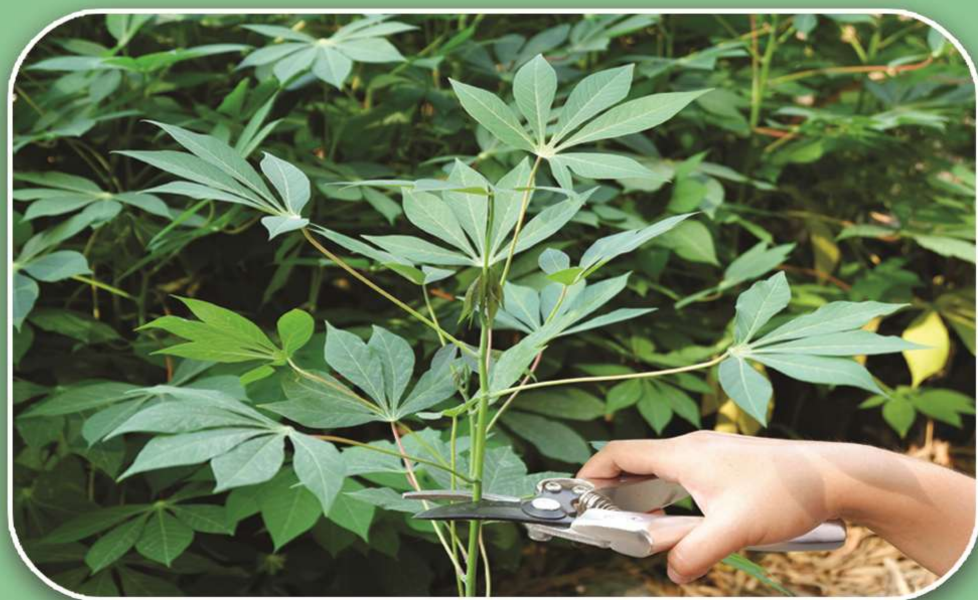
ตัดยอดยาวประมาณ 10 เซนติเมตร