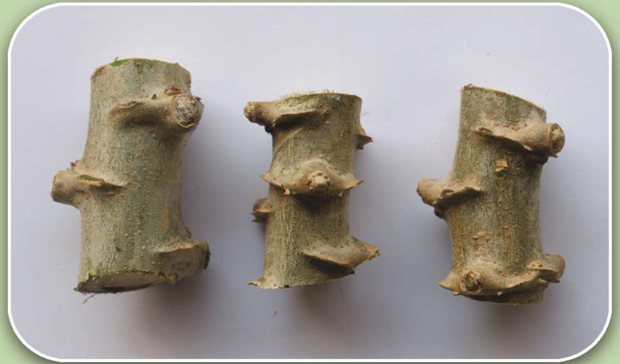
ตัดเป็นท่อนยาวท่อนละ 6 - 8 เซนติเมตร

“ การขยายพันธุ์มันสำปะหลังปลอดโรคใบด่าง ด้วยวิธีเร่งรัด X20 หมายถึง การขยายพันธุ์มันสำปะหลังที่ได้ต้นพันธุ์เพิ่มขึ้น 20 เท่า เป็นวิธีการที่สามารถทำได้ง่าย โดยในเวลา 1 เดือน จะได้ต้นพันธุ์มันสำปะหลังถึง 20 ต้น ซึ่งมีประสิทธิภาพเพิ่มขึ้น จากวิธีขยายพันธุ์มันสำปะหลังแบบเดิมซึ่งมันสำปะหลัง 1 ลำ จะขยายพันธุ์ได้เพียง 4 - 5 ต้นเท่านั้น ”