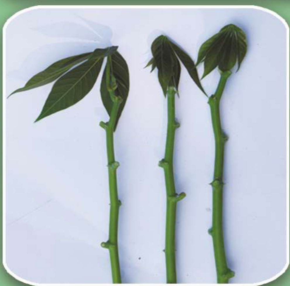
ตกแต่งยอด