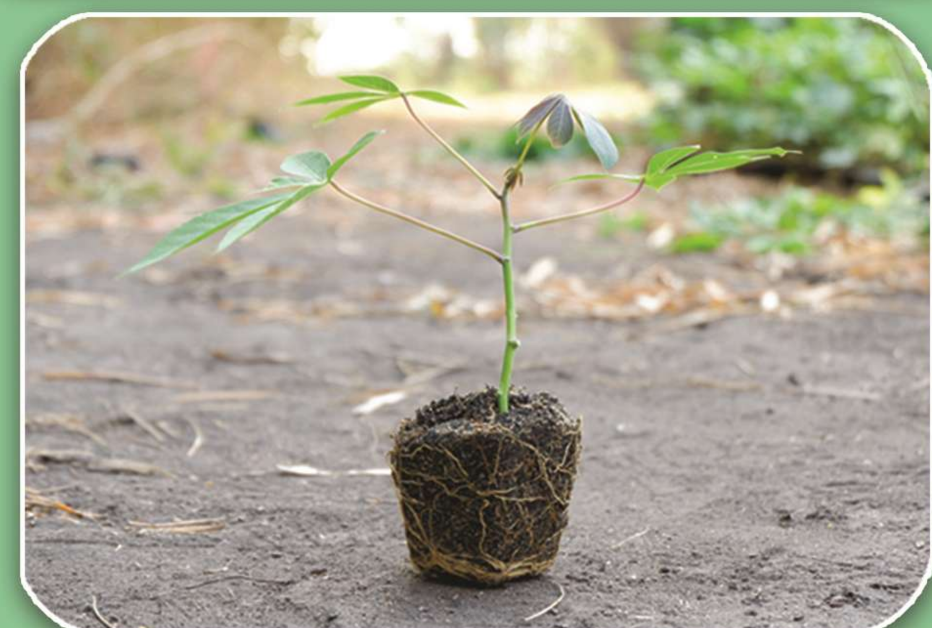
ต้นมันสำปะหลังพร้อมปลูก