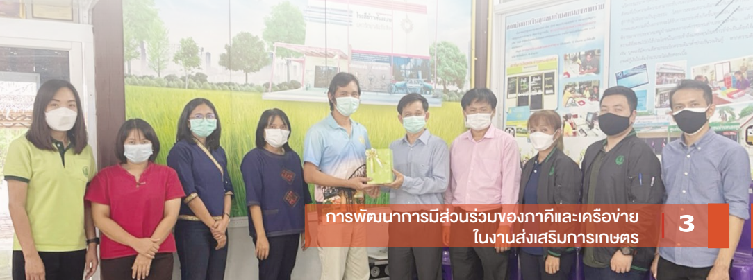
การพัฒนาการมีส่วนร่วมของภาคีและเครือข่าย ในงานส่งเสริมการเกษตร