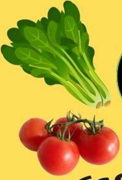
โรคเน่าเละ